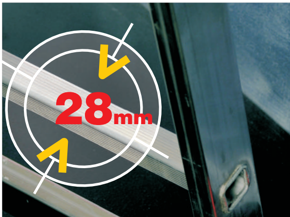
Piolo 28x28 in alluminio estruso antisdrucchiolo con angoli arrotondati rungs 28x28 mm in anti-slip extruded aluminium with rounded corners

ORANGE is a 2 and 3 elements ladders range. For professional use, practical and easy to use , renewed in detail: steel hinge, rung 28x28 mm guaranteed minimum area and antiopening strong belts . Pitch of rungs 280 mm.