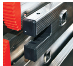
Agevolatore inserimento base stabilizzatrice Facilitator for insert stabilizer base