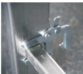
Dispositivo di blocco tronchi (antisfilo) Element blocking (anti-loosening) device