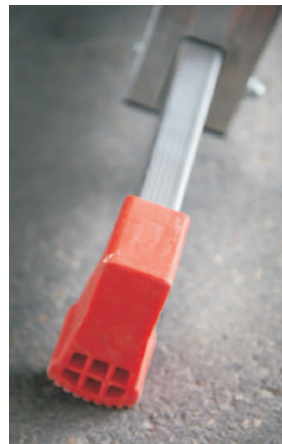
Base con tacco in pvc antiscivolo miscela morbida Stabilizer base with not-slip soft compound PVC feet