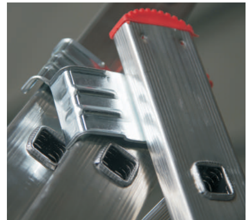
Cerniera in acciaio (in caso di urto non si rompe) con agevolatore di apertura Steel hinge (in case of impact does not break) with opening facilitator